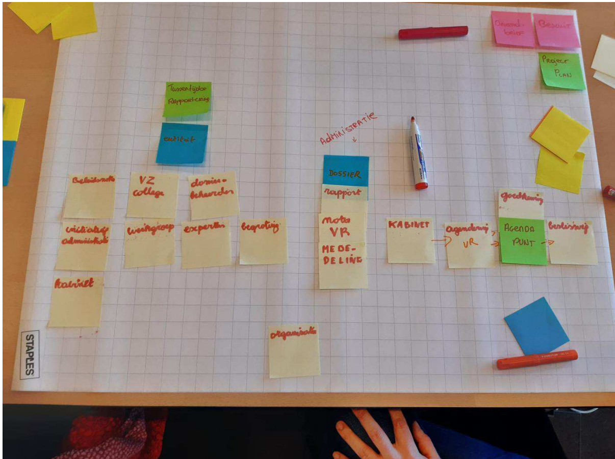
Fig. 3: Clustering en verbanden tussen de informatiecontainers in functie van use case 1

Op basis van het proces van case 2 – werden verbanden tussen de verschillende informatiecontainers duidelijk.